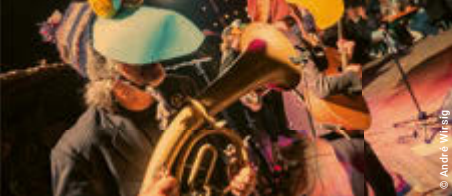
© André Wilsing © André Wilsing