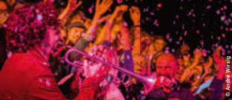
© André Wisig © André Wisig