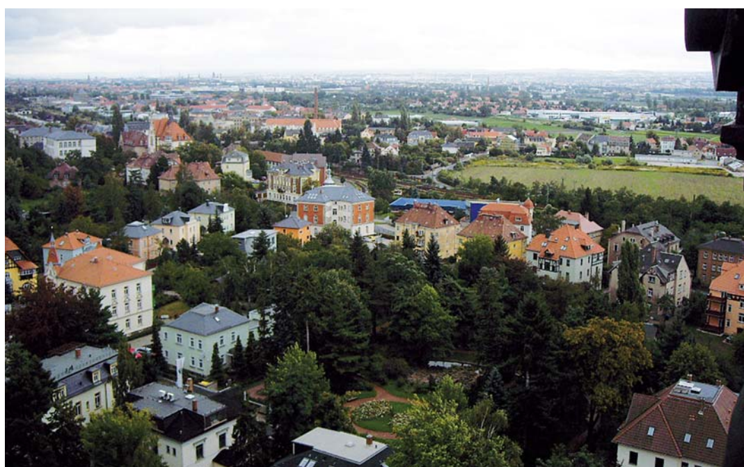
Blick vom Turm der Lutherkirche auf den Karl-May-Hain

So wird sich der Erweiterungsbereich in zwei Gebiete aufteilen. Das erste grenzt direkt an das bestehende Sanierungsgebiet an – von der Pestalozzistraße Höhe Technisches Rathaus bis zur Kreuzung Pestalozzistraße/Schildenstraße. Der zweite Teil – die sogenannte Insellösung – beginnt an der Schildenstraße (Höhe Weinberghäuschen) und führt durch den Karl-May-Hain über die Karl-May-Straße bis zur Meißner Straße. Eingeschlossen sind dabei das Karl-May-Museum und die Lutherkirche. Der Stadtrat hatte dieser Lösung bereits im April dieses Jahres zugestimmt.