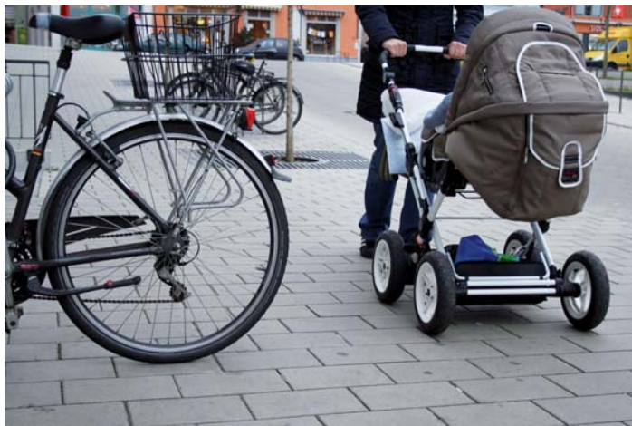
Auch für Kinderwagen ist die Engstelle an dem Fahrradständer ein Hindernis.